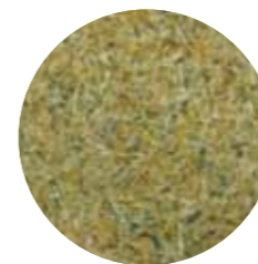
PCB Line Pó de Plástico