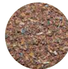
PCB Line Pó de Metal

O material resultante de nossas linhas de produção é um pó, que se torna base para a matéria prima para diversos segmentos da indústria.