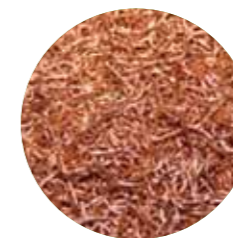
Cooper Line Cabos de Cobre