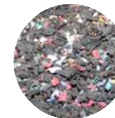
Cooper Line Cabos de Plástico